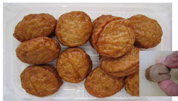
実用化された血合肉薩摩揚げ (特許第5606657号 H26.9.5取得)